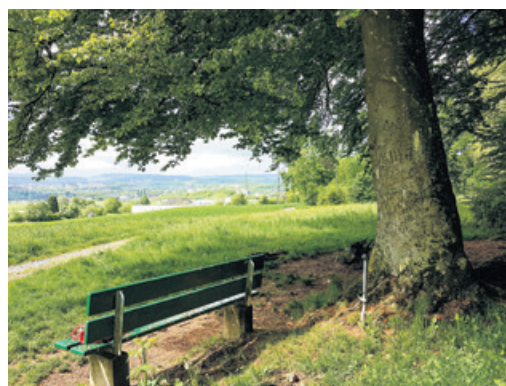
Aussicht vom prüfenswerten Standort Bottisacher