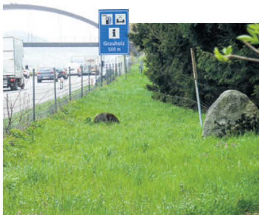
«Unort»: Bottisgrab hart an der Autobahn

Der Verein NUBIS stellt seit 2017 seine Homepage zur Verfügung, um die Informationen zum Bottisgrab und zur geplanten Verlegung für die Öffentlichkeit zugänglich zu machen. Auf der Homepage der Gemeinde gibt es nach wie vor keine Angaben zu diesem Natur- und Kulturgut. Interessierte finden unter www.nubis-verein.ch/projekte/verlegung-bottisgrab eine umfassende, kapitelweise gegliederte, illustrierte Dokumentation zur «unendlichen» Leidensgeschichte des Bottisgrab.